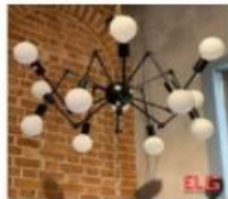
خرید آویز عنکبوتی | بهترین قیمت