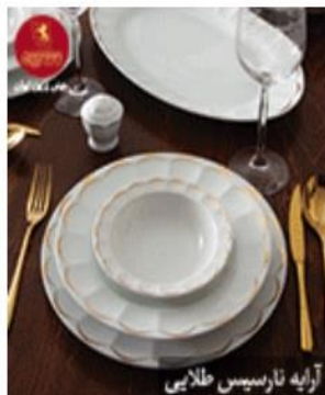
آرایه نارسیس طلایی

« یارانه ماه رمضان برای چه کسانی واریز می شود؟