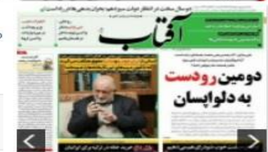
روزنامه های شنبه