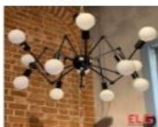
خرید آویز عنکبوتی | بهترین قیمت