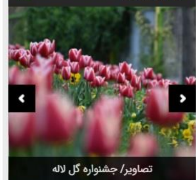
تصاویر/ جشنواره گل لاله