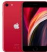
مقایسه گوشی iPhone SE با بهترین پرچمداران اندرویدی