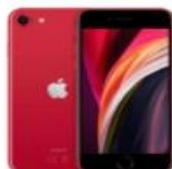
مقایسه گوشی iPhone SE با بهترین پرچمداران اندرویدی